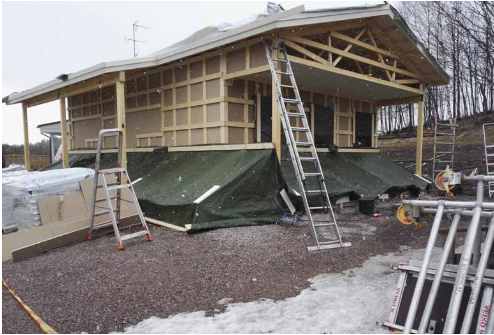
Rakennuksen runko saatiin pystyyn maaliskuussa.

vetona, kustannukset laskivat selvästi ja viemäriverkkoon liitettiin vuonna 2016. Samalla käynnistyi vauhdilla uuden huoltorakennuksen suunnittelu. Yhdistyksen jäsenet toivoivat suihku- ja wc-tilojen lisäksi huoltorakennukseen myös pesulamahdollisuutta.