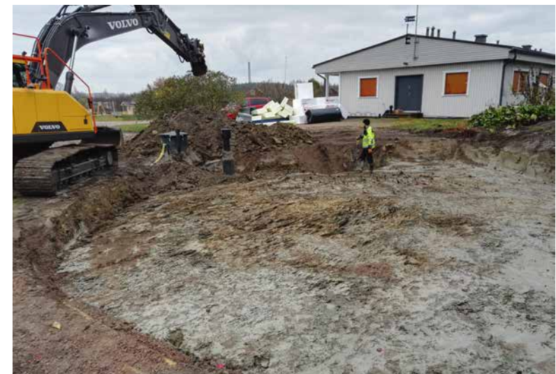
Perustusten teko alkoi marraskuussa rakennuspaikan kaivuulla ja tasauksella.

Kerhotalon remontti saatiin kokonaisuudessaan valmiiksi vuonna 2013 Freesen suunnitelmien pohjalta, mutta uuden huoltorakennuksen esteeksi muodostuivat liian suuret viemärintikustannukset. Jätevesien käsittelyn saaminen nykyvaatimusten mukaiseksi olivat olleet keskeinen peruste kerhotalon käytölle ja uuden huoltorakennuksen rakentamiselle. Onneksi ratkaisuksi löytyi viemärinto pinta-