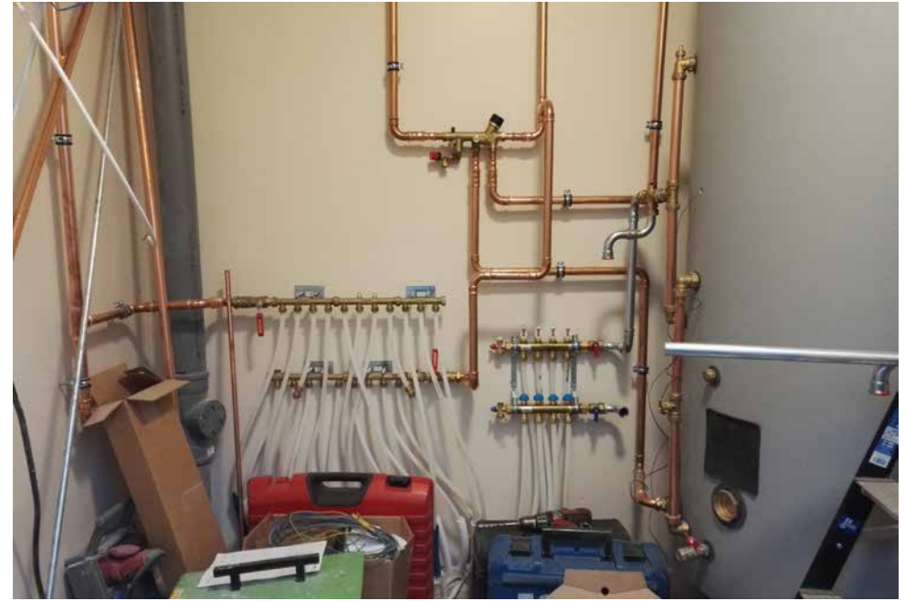
Lämmitysjärjestelmänä on vesi-ilmalämpöpumppu, joka lämmittää lattiat ja käyttöveden. Lämpö saatiin päälle toukokuussa.